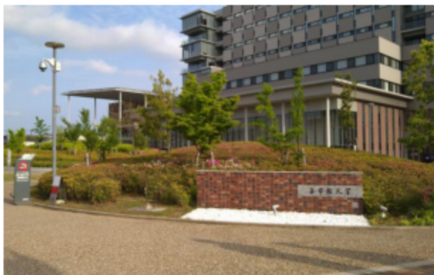
③ さらに進むと、左手に立命館大学 大阪いばらきキャンパスの北エントランスが見えてきます。 (2ページ目に続く)