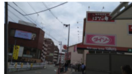
① エスカレーターから見える風景