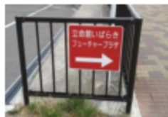
② 道なりに進むと、上記の標識が現れます。